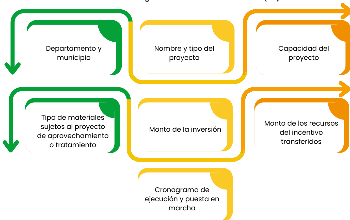
Gráfica 5. Insumo registros Sistema único de información (SUI)