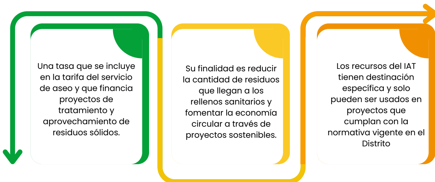
Gráfica 1. Características del IAT