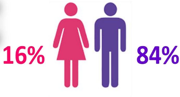
Ilustración. Muertos por género